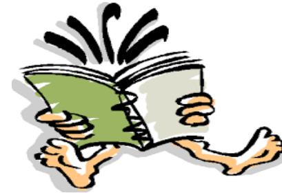
Lecturas por parte del estudiante