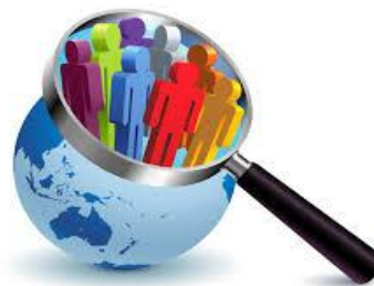
Investigación de los temas