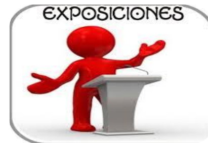
Exposiciones por parte de estudiantes